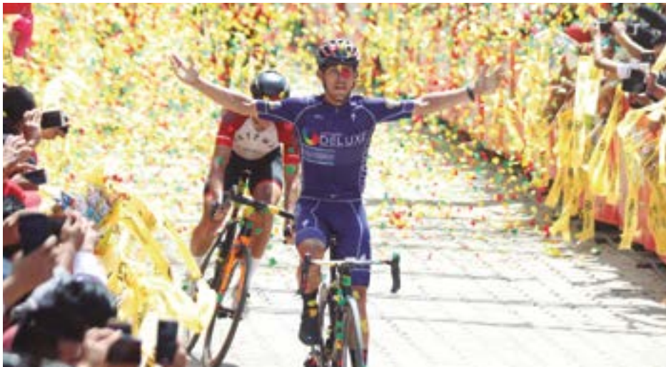
La fiesta grande del ciclismo en Guatemala sigue siendo un gran atractivo internacional, por eso asisten los mejores corredores de la región.