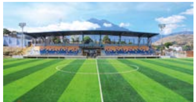
Hermosa vista y digno recinto para eventos deportivos