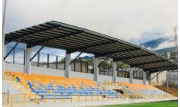
"Lico" Bethancourt nos explicó las bondades de la obra