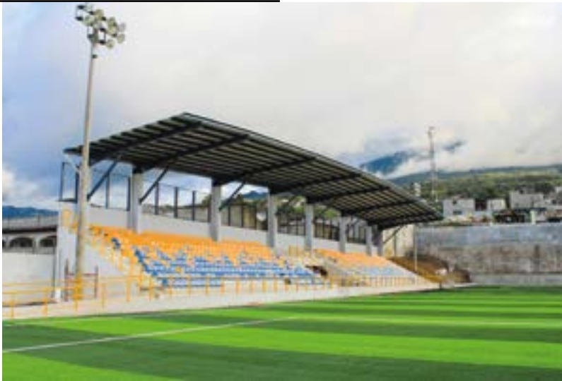
El Estadio Municipal Hunapú, llamado así en honor al Volcán de Agua, cuenta con 1600 butacas y espacios para sillas de ruedas.